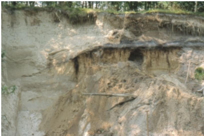
Bild 3: Brammerau, Dünenaufschluß im Überblick