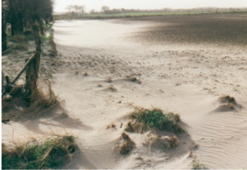
Bild 1: Dünenbildung durch Winderosion in Hüllerupfeld, westl. Flensburg, am 11.04.1997