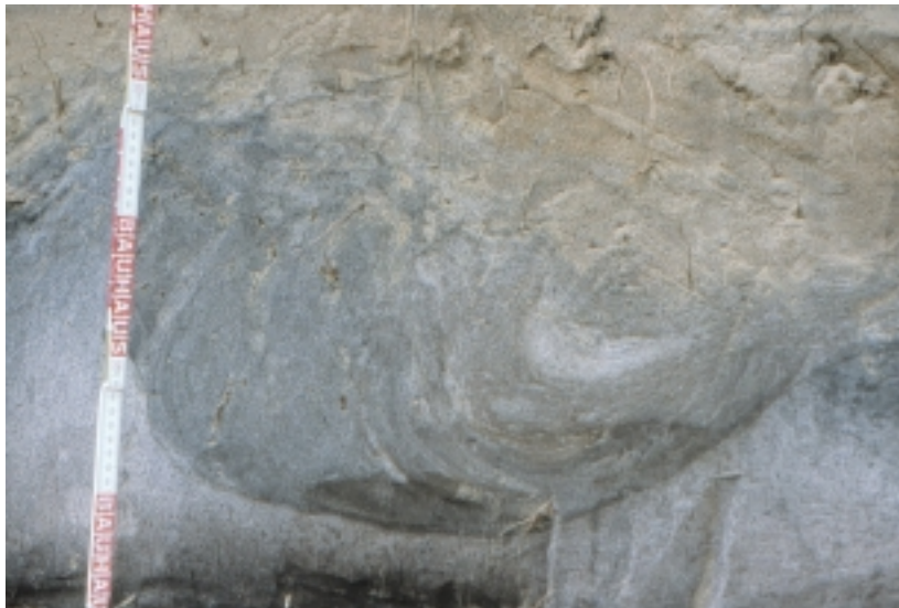
Bild 6: Brammerau, Umlagerung im fAh durch Fließvorgänge (?)