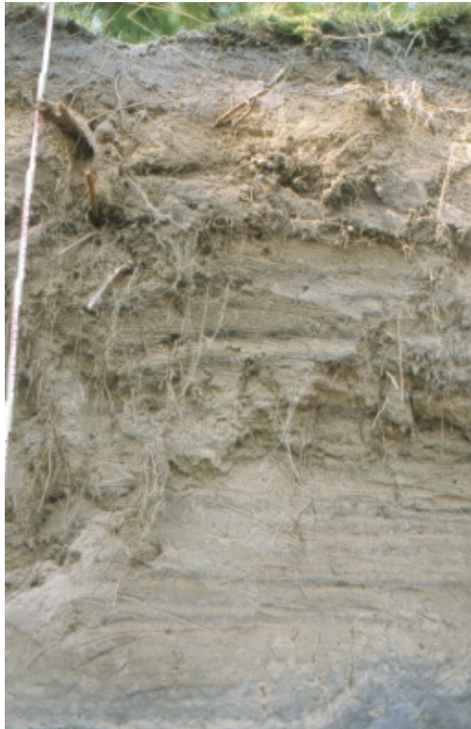
Bild 2: Brammerau, oberer Teil der Düne mit Humusbändern