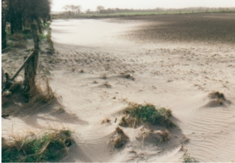
Bild 1: Dünenbildung durch Winderosion in Hüllerupfeld, westl. Flensburg, am 11.04.1997